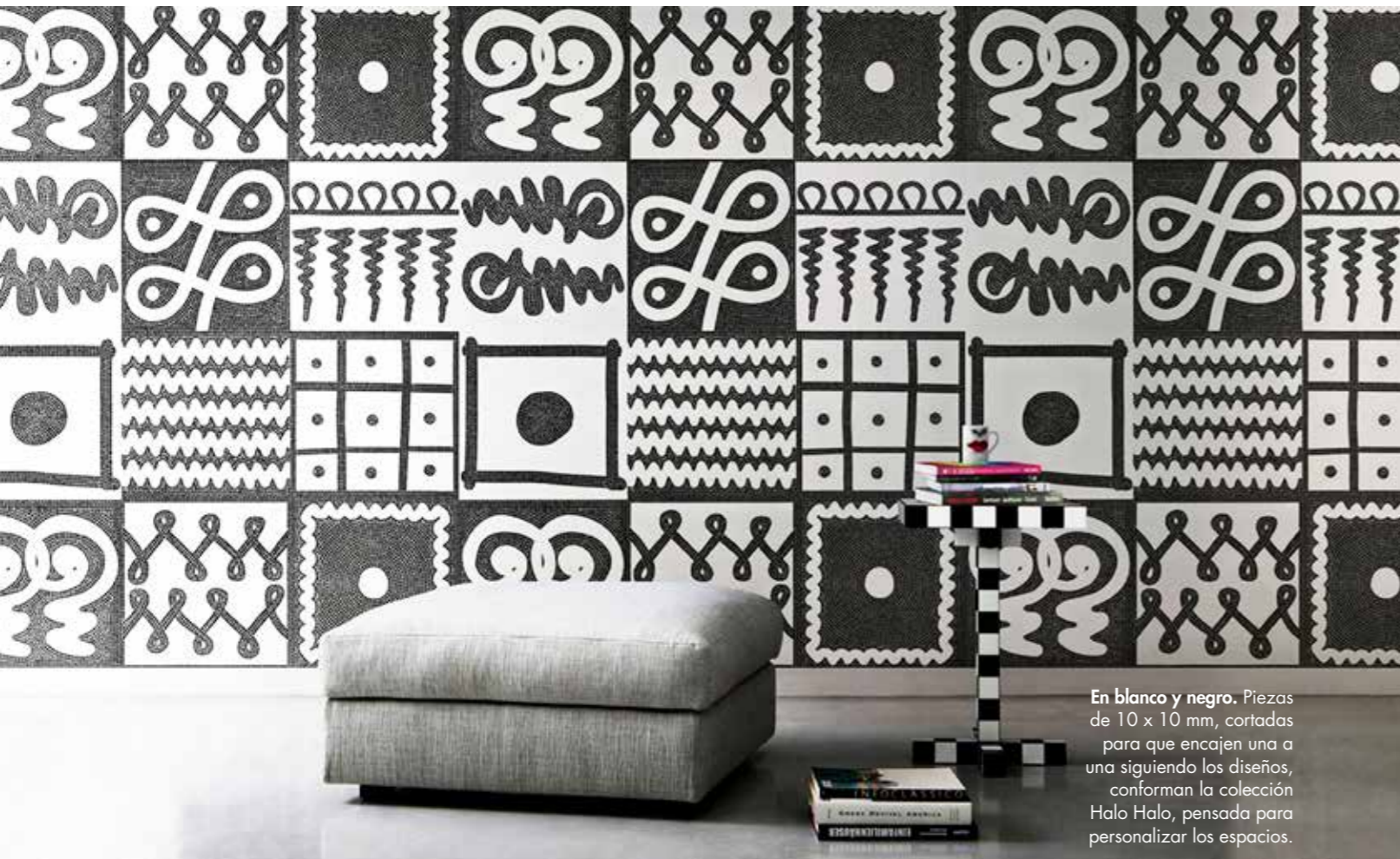
En blanco y negro. Piezas de 10 x 10 mm, cortadas para que encajen una a una siguiendo los diseños, conforman la colección Halo Halo, pensada para personalizar los espacios.