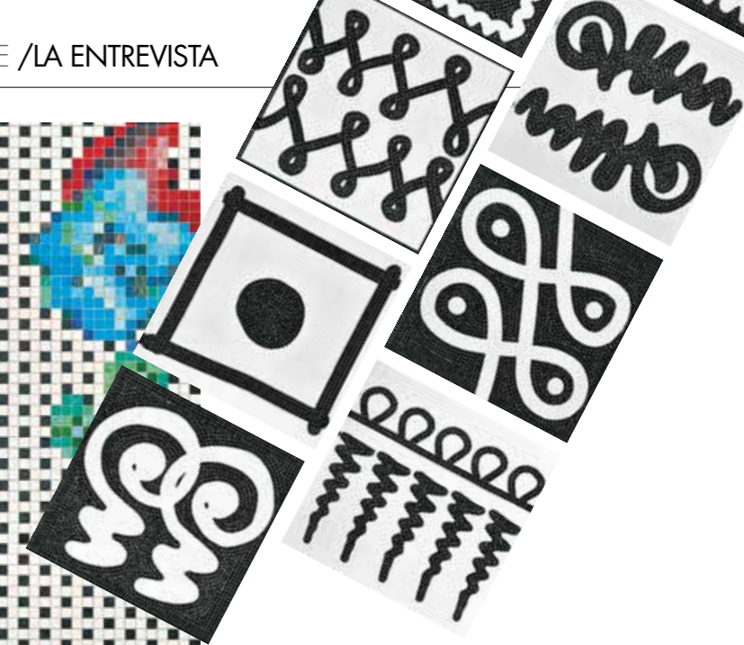
Tradición inventada. Affresco evoca un falso clasicismo sobredimensionado y con un punto tecnológico, mientras que Halo Halo desprende un aura étnica y urbana.

“Motivos de lugares lejanos y tiempos pasados se mezclan de forma desdibujada. Quizá todavía haya algo oculto debajo...”